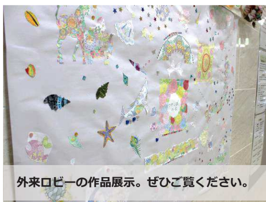
外来ロビーの作品展示。ぜひご覧ください。

誕生したのは平成24年、早いものでもう7年目となります。グループ創成期はスタッフがメインで1年間（全24回）の活動内容を決めていましたが、ここ数年はメンバーが主体となって意見やアイデアを出し合い、自分たちがどういうことに取り組むかを決める流れができています。少人数と言えども、グループで経験することの中には、社会生活で必要なことに触れるチャンスがたくさん詰まっています。初めは緊張し、居る