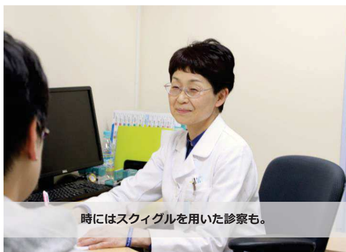
時にはスキグルを用いた診察も。

Aさんは高校生の頃、得意だった箸の塑像のスケッチが、突然、何度描いても茫漠とした線の集合にしかならず、美術教師に「どうした？」と声を掛けられたことがありました。そのときは理由が分からなかったけど、何年か経ち、「あのとき色々あったけど、自分の心のSOSが絵に表れていたのかなあ。」と思ったそうです。「子どもの話すことはゲームの話ばかりで、全然気持ちを話してくれないんですよ」という話も良く聞きますが、『アニメやゲームのストーリーに、言葉にならないどんな気持ちが投影されているのか、考えを巡らせながら耳を傾けること』の大切さを患者様から教えられました。